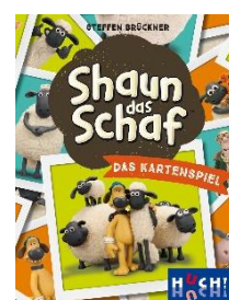
Autor: Steffen Brückner Für 2 – 6 Spieler, ab 8 Jahren Spieldauer: 20 min., Preis ca. 8,49 €

Die Vertriebsgesellschaft Hutter Trade erblickte 2004 das Licht der (Unternehmens-)Welt. Zeitgleich wurde die Verlagsmarke HUCH! gegründet, die wiederum durch Hutter Trade vertrieben wird. Seitdem gehen die Entwicklung als auch der Vertrieb von ausgezeichneten und abwechslungsreichen Spielen Hand in Hand. Mit innovativen Kinder- und Familienspielen mit Lifestyle-Charakter, Strategiespielen und facettenreichen Vertriebsprodukten haben sich HUCH! und Hutter Trade ein ganz eigenes Profil geschaffen.